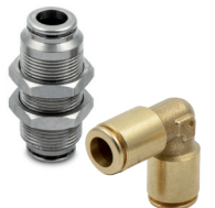
Raccordi automatici in ottone senza piombo serie F-E e F-NSF, tubi da Ø 4 a 10 mm, filetti da M5 a 1/2".