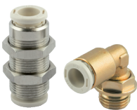
Raccordi automatici in ottone senza piombo serie F-E PLUS e F-NSF PLUS, tubi da Ø 4 a 10 mm, filetti da M5 a 1/2".