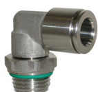
Raccordi automatici in acciaio inossidabile AISI 316, tubi da Ø 4 a 12 mm, filetti da M5 a 1/2".