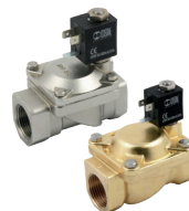
Elettrovalvole 2 vie servoassistite, membrana, corpo ottone o inox.